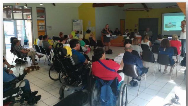
A Gap le 30 juin