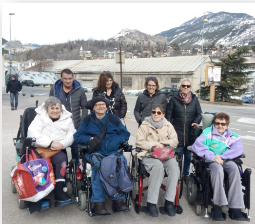
Une partie des membres du Groupe SEP APF 05 à Briançon en mars dernier!