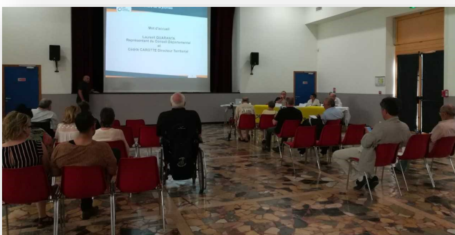
A Château Arnoux le 26 juin