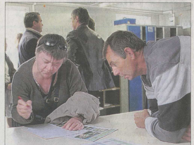
Des familles visitent la Mas en construction à Saint-Surnin : c'est le type d'accueil qu'elles voudraient obtenir pour les jeunes.

Ainsi, disent-ils, le coût de l'extension serait faible pour offrir des prestations maximales aux personnes polyhandicapées des Hautes-Alpes. À l'issue de la visite, les familles enthousiastes ont décidé d'agir auprès de l'ARS. Dans un premier temps, elles vont envoyer des courriers circonstanciés et solliciter un rendez-vous auprès de la direction territoriale de l'ARS. Un parent propose : « Allons à ce rendez-vous avec nos enfants polyhandicapés pour que les fonctionnaires voient bien en quoi le polyhandicap nécessite une structure spécifique. »